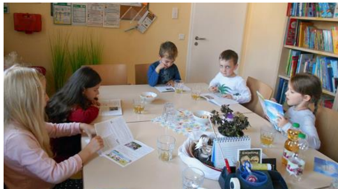
Der Kinderrat bei der „Arbeit“

Ich freue mich, dass Essen auszusuchen und ich freue mich, dass ich die Kinder trösten kann und wenn die Kinder streiten helfe ich, dass sie sich wieder vertragen