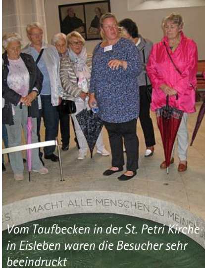
Vom Taufbecken in der St. Petri Kirche in Eisleben waren die Besucher sehr beeindruckt

Die Landesausstellung „Bauern, Ritter Luthera-ner“ auf der Veste Coburg war dann der Höhepunkt. An vielen Exponaten wurde gezeigt wie sich die Welt ab am Jahr 1500 veränderte.