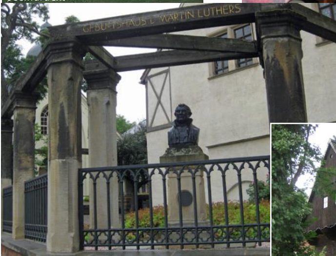
Am 10. November 1483 begann in diesem Fachwerkhaus in der Lutherstadt Eisleben das ereignisreiche Leben von Martin Luther