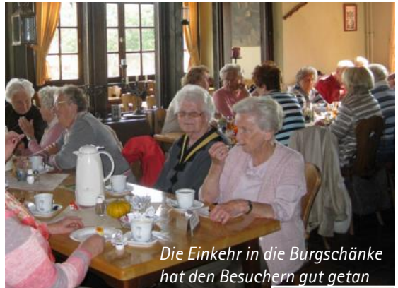
Die Einkehr in die Burgschänke hat den Besuchern gut getan