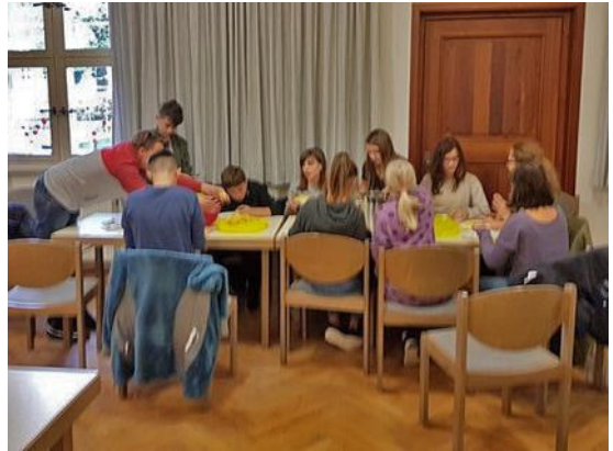
Jugendliche in Aktion

Alle Jugendlichen zwischen 14 und 17 Jahren sind herzlich willkommen, mit zu kochen, nicht nur unsere Konfis.