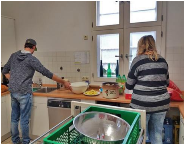
Eltern eines Konfirmanden, die die Kost-bar-Nachmittage unterstützen, indem sie die Gerichte fertigstellen, während die Jugendlichen draußen spielen

Gerade um diesen Aspekt geht es auch an den „Kost-bar-Nachmittagen“, die gerne mit der Frage beginnen: „was machen wir heute?“: Natürlich kochen, aber vor allem Gemeinschaft leben; denn es wird nicht nur zusammen Essen vorbereitet, sondern auch gemeinsam gespielt. Wir lernen uns dabei kennen und können auch einmal vor Anderen weinen (wegen den Zwiebeln) oder können stinken (nach Knoblauch) und niemanden stört es. Ganz im Gegenteil: Es wird viel dabei gelacht und wir haben dabei viel Freude.