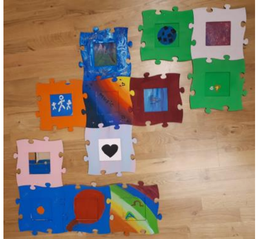
Gestaltete Puzzle-Teile der Konfirmierten-Fahrt

Sei es das Raclette-Essen oder das Chaos-Spiel, bei dem wir das Neukirchner Bildungsstättenhaus in Beschlag nahmen, oder bei den Gemeinschafts-Aktionen mit der ejott und der Jugendbildungsstätte Neukirchen. Dabei sind auch die Puzzle-Teile entstanden, die versinnbildlichen, dass wir trotz unserer Unterschiede eine Gemeinschaft bilden.